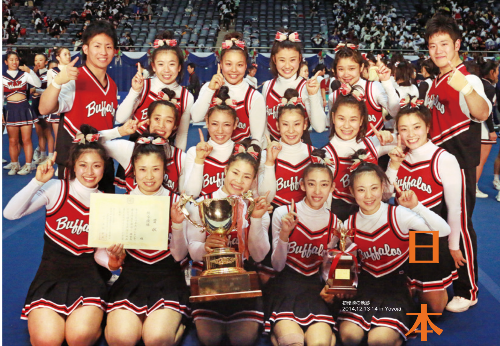
初優勝の軌跡 2014.12.13-14 in Yoyogi