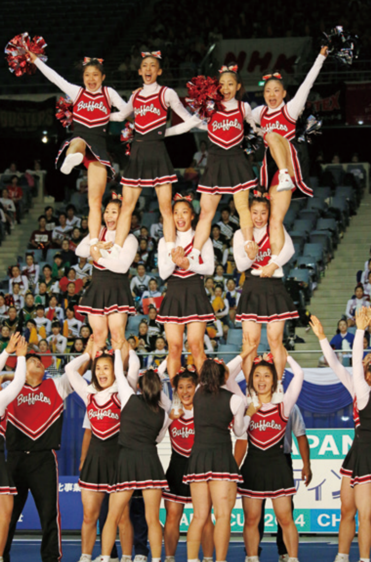
参照資料:「SPORTS X」BS朝日、2015年3月1・8日放送