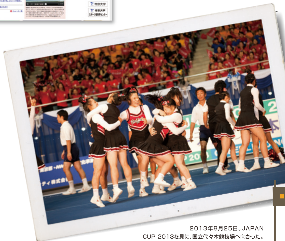
2013年8月25日。JAPAN CUP 2013を見に、国立代々木競技場へ向かった。Division.1 競技部門が始まり、次々と他校が演技をしていく。最後から2番目が帝京大学。彼女たちの演技は、会場中を巻き込み、すごい熱気を放った。そしてパーフェクトなフィニッシュ! 彼女たちの嬉しそうな顔を見て、自然と涙がこみ上げてきた。続く日本文理大学が、こめた完璧としか言いようのない演技を披露し、僅差で2位になった帝京大学だったが、あの一体感と高揚は忘れられない。(片山)